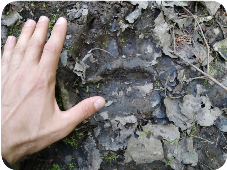
6. Свежие следы медведя. Июнь 2021