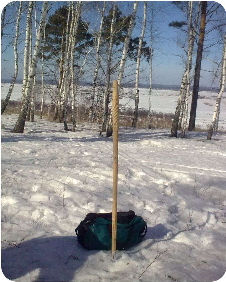
3. Жреческий посох Ярилы. После огненного риту-