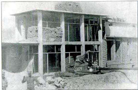
«Развалины». Афганский блокпост.