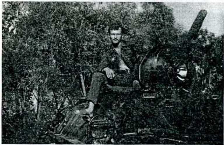
Кандагар. 1984 г. Л. В. Андреев