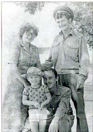
Прощание с Родиной.