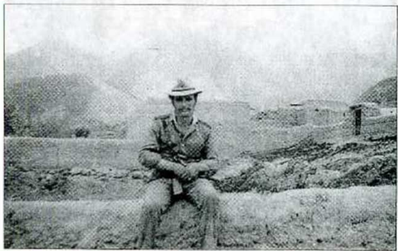
После взятия кишлака.