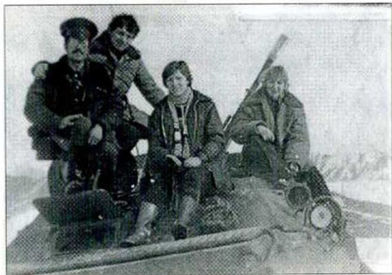
Свадьба в Кабуле.