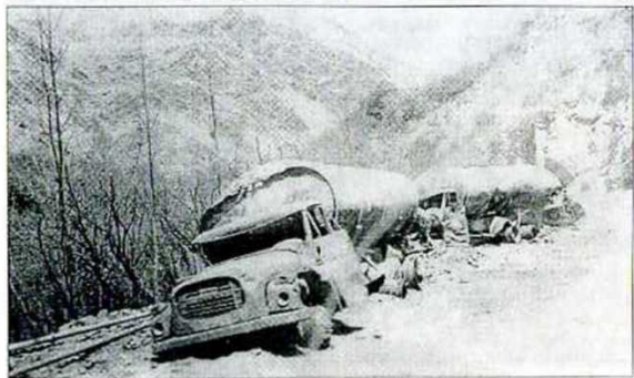
После обстрела колонны.