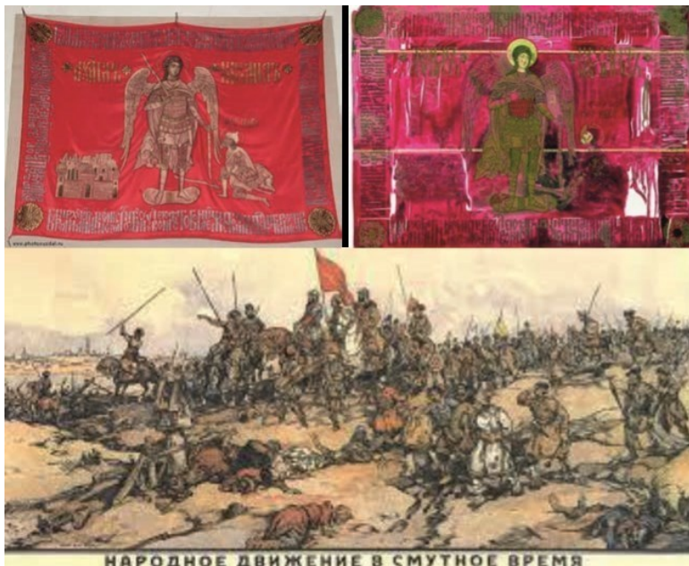
Рис. 14. Народное движение в Смутное время. Художник А. Апсит. 1918 г.

Рис. 13. Христос Воскресе! С нами Бог, да воскреснет Россия. Художник П. Дмитриев