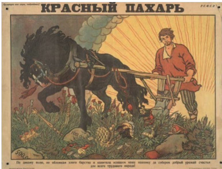
Рис. 7. Красный пахарь: «По дикому полю, по обломкам...». Художник Б.В. Зворыкин 1920 г.

А. Аписит блестяще сохранил в плакате дух быliny: внешний облик пахаря почти не претерпел изменений, шелковые шнуры и кисти на упряжи (показатель благополучия земледельца) сохранены, но все элементы роскоши (отделка сохи драгоценными металлами, сафьяновые сапоги) решительно убраны. Экстерьер коня точно соответствует былинному, но цвет изменен на вороной – менее парадный и более агрессивный. Одежду пахаря он тоже поменял с черного кафта-