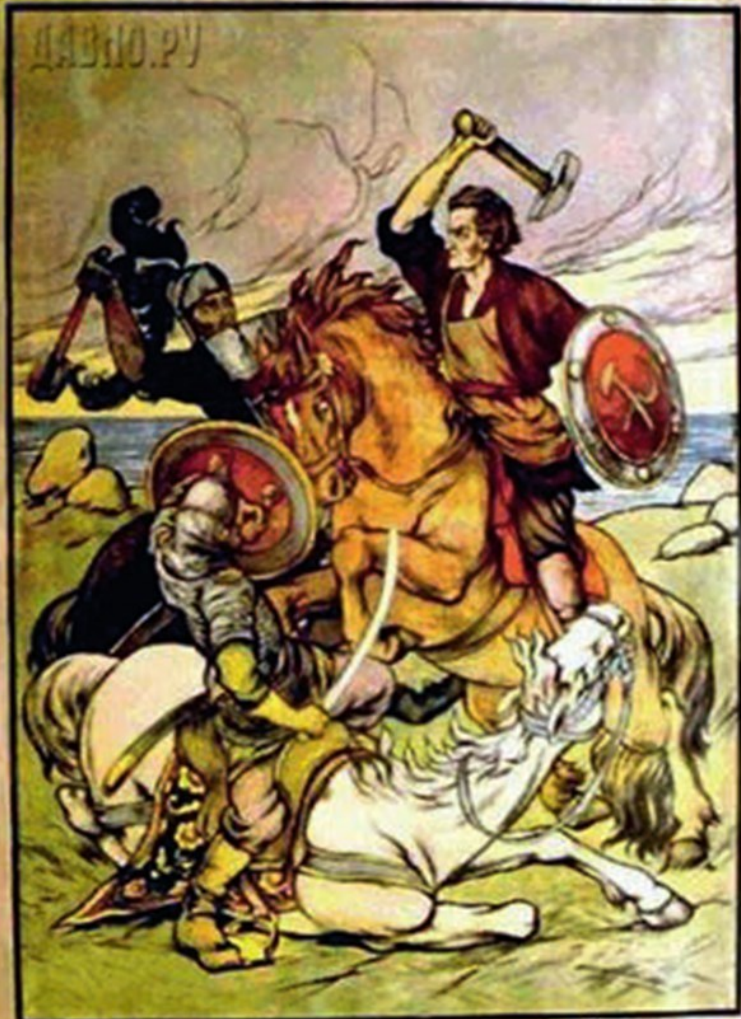
БОРЬБА КРАСНОГО ВЪШАРА С ТЕМНОЙ СИЛОЮ