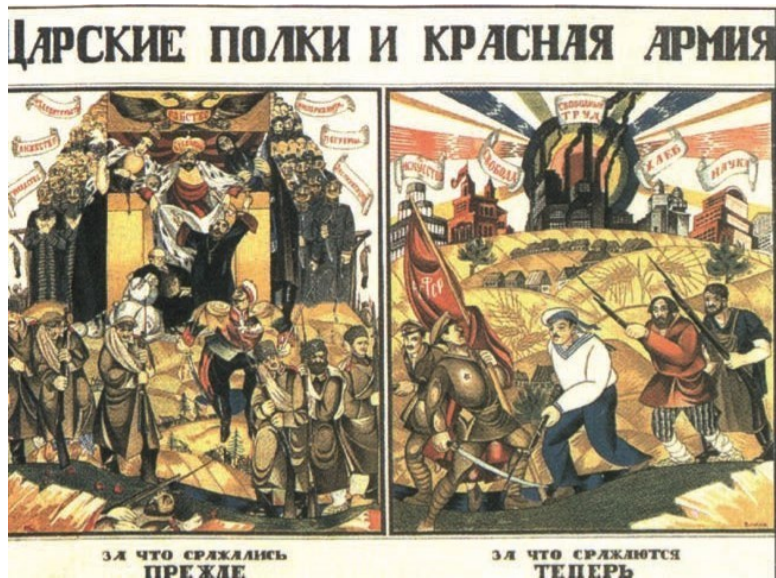
Рис. 1. Царские полки и Красная Армия. Художник Д.С. Моор. 1919 г.

Схожесть используемых образов поражает. Любопытно, что тщательно прорисованному дьяволу противостоит не Господь, не Архангел с огненным мечом, а маленький статичный крест. Как будто образ взят из сказки, записанной Н.Е. Ончуковым: небеса пусты и бездеятельны. Священнослужители, как олицетворение будущего, на контрреволю-