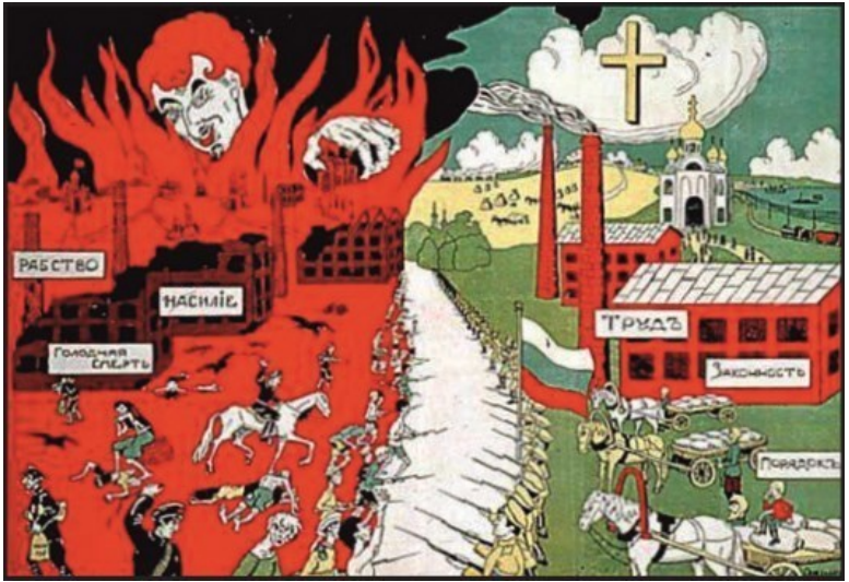
Рис. 2. Белые против красных. Белогвардейский плакат времен Гражданской войны

ционных плакатах если и присутствуют, то только в качестве мучеников. А вот золотые купола храмов можно увидеть (рис. 3).