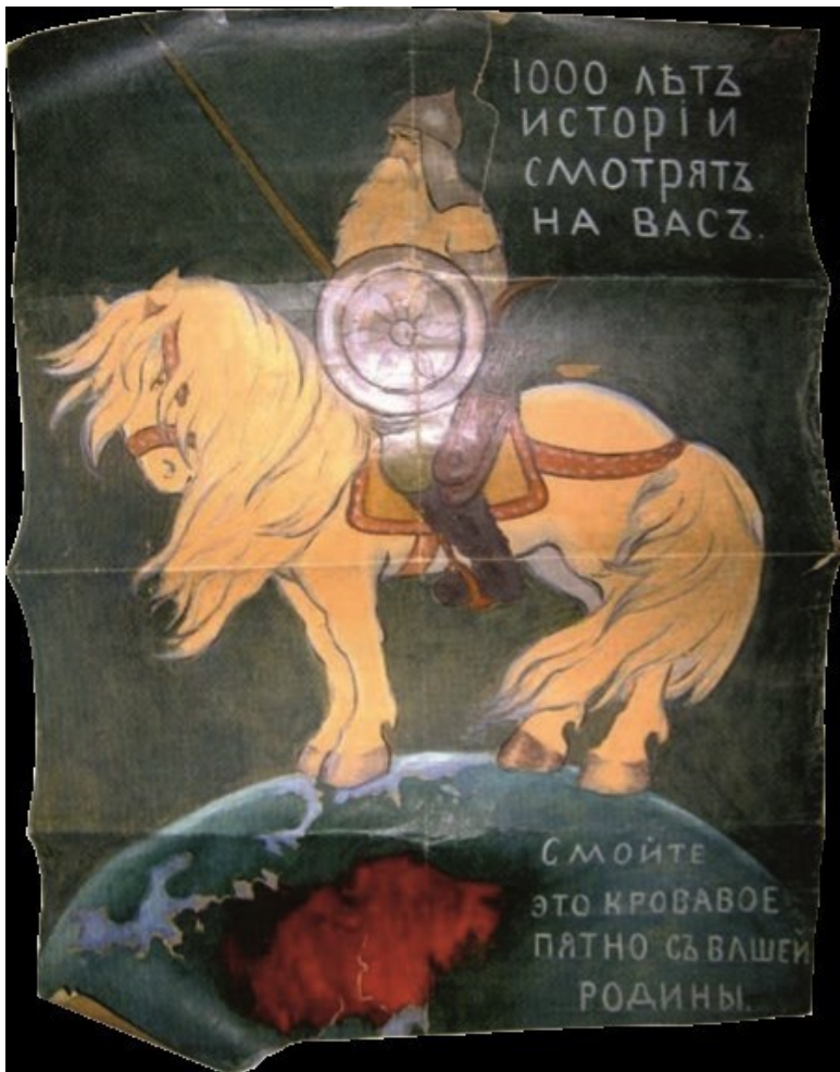
Рис. 12. 1000 лет истории смотрят на вас. Неизвестный