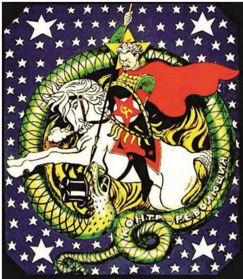
Рис. 15. Лев Троцкий в образе Георгия Победоносца, убивающий змея контрреволюции. Художник В. Дени. 1918 г.

Подводя краткий итог, надо заметить, что и «красные» и