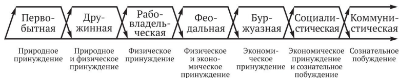
Рис. 1. Смена формаций и типов принуждения (побуждения) работников к труду 33

Историческую эволюцию типов принуждения работников к труду в результате социальных революций и смены формаций можно представить в следующей схеме (рис. 1).