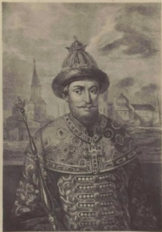
Царь Михаил Михайлович С портрета работы в Императорском Эрмитаже.