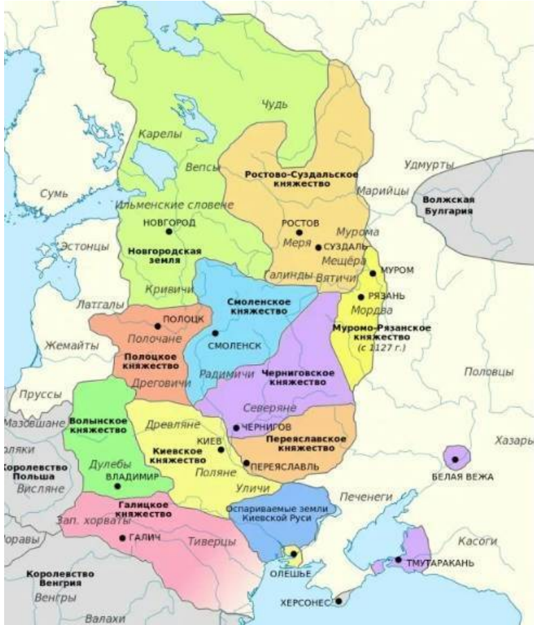
Данная карта "Княжества поздней Киевской Руси", автора SeikoEn, обработанная пользователем Das steinerne Herz