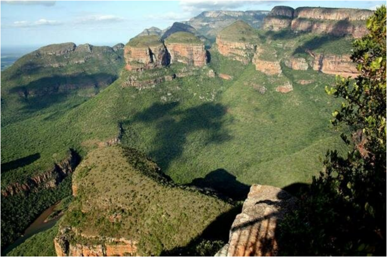
Фото «Адамова Календаря в Южной Африке» (Adam's calendar in Mpumalanga, South Africa ( Wikimedia Commons )), с Викисклада (оригинальное название «Three Rondavels, Blyde River Canyon Nature Reserve, Mpumalanga, South Africa.jpg»)

Исследование последних лет древнейших мегалитов Южной Африки (т.н. «Календаря Адама») датируют это сооружение вообще не менее 75 000 лет до н.э.[1,2,3]