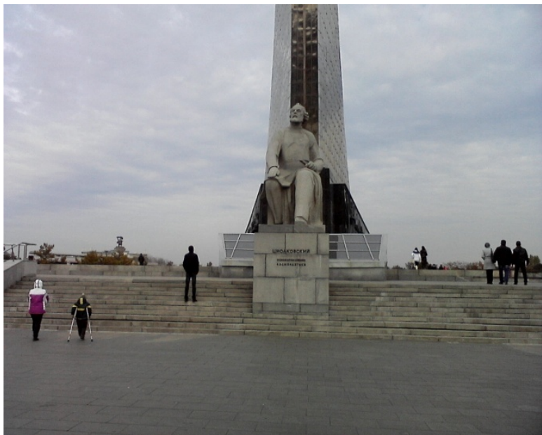
Москва. 2015 год.

Хорошо жить в Москве. Но слишком шумно и суетно. И, как ни странно, по доходу на душу населения Москва не стоит на первом месте, она лишь на третьем. Первые два места занимают Чукотка и Ямал. И лишь потом Москва и остальная Россия. Зарботки в Москве большие, но и цены непомерные. Особенно на жилье. Лучше обустроится в своем городе или деревне, а в Москву приезжать на экскурсию.