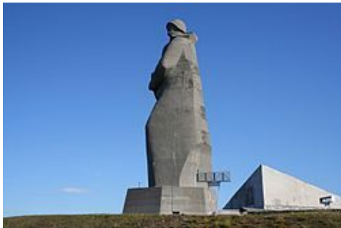
Мурманск. 2019 год.

Второй раз автор в Мурманск прилетел через год на самолете. Из международного аэропорта Мурмаши он на автобусе проехал практически через весь город. Осмотрел достопримечательности в центре города – на площади Пять Углов. Здесь расположено самое высокое здание в городе – восемнадцатипятиэтажная гостиница «Арктика», а также первый памятник Мурманска – памятник жертвам иностранной интервенции 1918 – 1920 годов. Поднялся на сопку и посетил мемориальный комплекс – памятник защитникам Советского Заполярья (мурманский Алёша). Он является одним из крупнейших памятников в России.