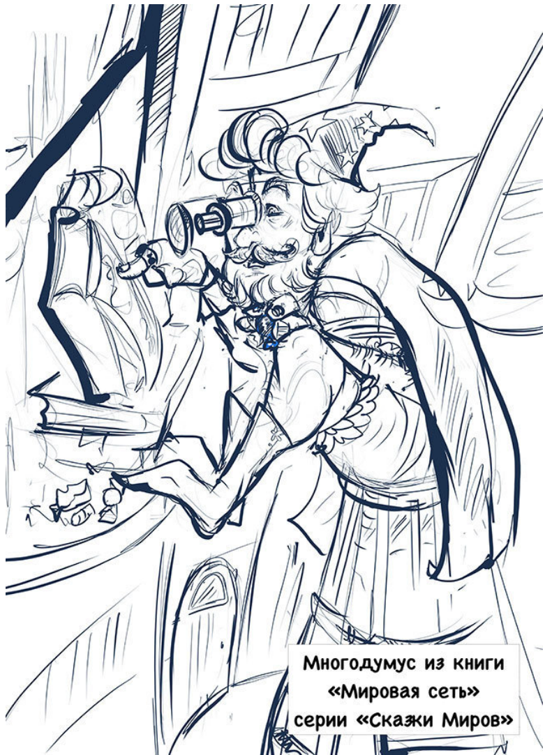
Многодумус из книги «Мировая сеть» серии «Сказки Миров»