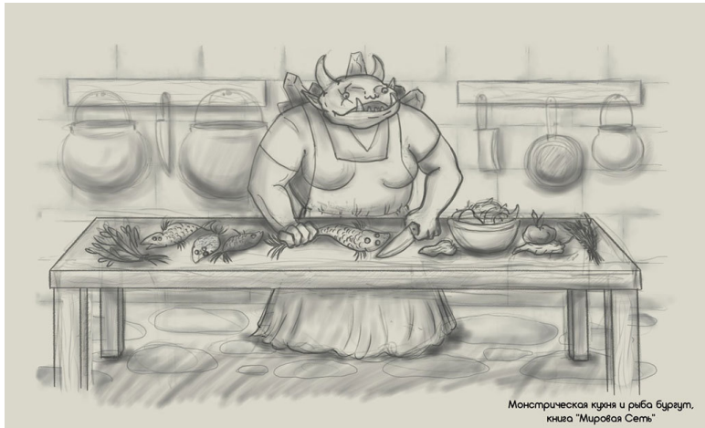
Монстрическая кухня и рыба бурзут. книга "Мировая Сеть"

Тем временем вся кухня приступила к кромсанию овощей. Стругали и молотили лук, морковь и странную репку, что по своей структуре и запаху была самой настоящей картошкой.