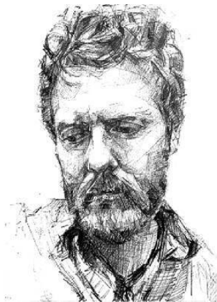
Рисунок из газеты «Земля» (Земля, Крестьянская газета, вып. № 7 от 16.02.2021 г. , г. Чита)

История наша о забайкальском мужичке, не такого большого таланта, как Левша, но все же профессионала. Великолепный сварщик – швы накладывает с хирургической точностью. Однако ж и он, по вышеописанным причинам, не смог реализоваться в своей профессии и в жизни в целом. Да! Губит, губит нашего брата русского мужика «крепкая».