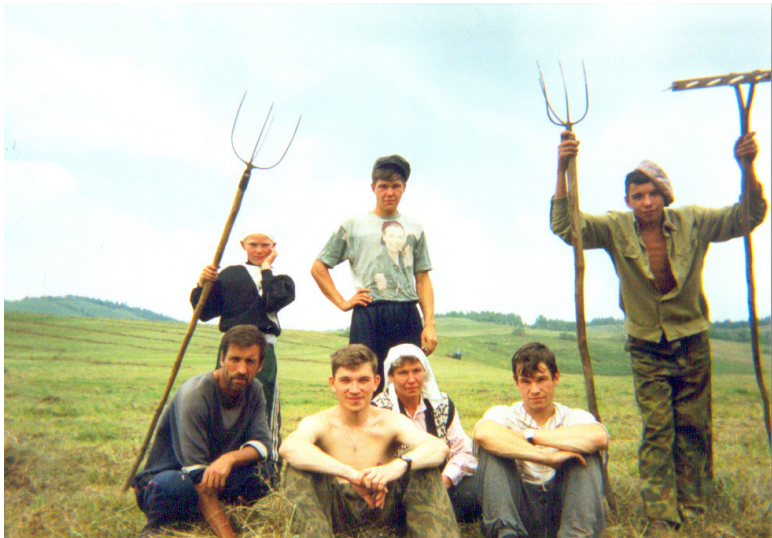
На сенокосе

Мы тогда ишшо коровёнок держали. Поехали большой кодлой сено сгрести и сметать сразу. Родня тока была. Сестры мужика маво с семьями помочь поехали. Ну и племяшка-то тоже была. Ей каво было-то тогда? Точно, поди, лет восемь. Все при деле были. Кто греб, кто на зарод кидал. Кто чего вобщем. Она тоже чевото помогала по силам. Отец-то ее на зароде сидел, на верху. Да Серёга! Ты ить поди его знаш?! Ну вот, вот! Он самый и есть. А он же вершит знатно, поэтому всегда на верху сидит. Курить ить там даже умуд-