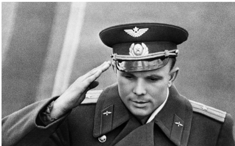
Верность принципам для меня - дело чести.

Честь – это верность принципам. Честные люди – старались ее не потерять. Чиновник отказывается брать взятки. Жена не предаёт мужа. Военнослужащий не сдаётся неприятелю. Каждый ставит во главу угла разные принципы. Не изменить им ни при каких обстоятельствах, даже если речь идёт о жизни и смерти, – дело чести.