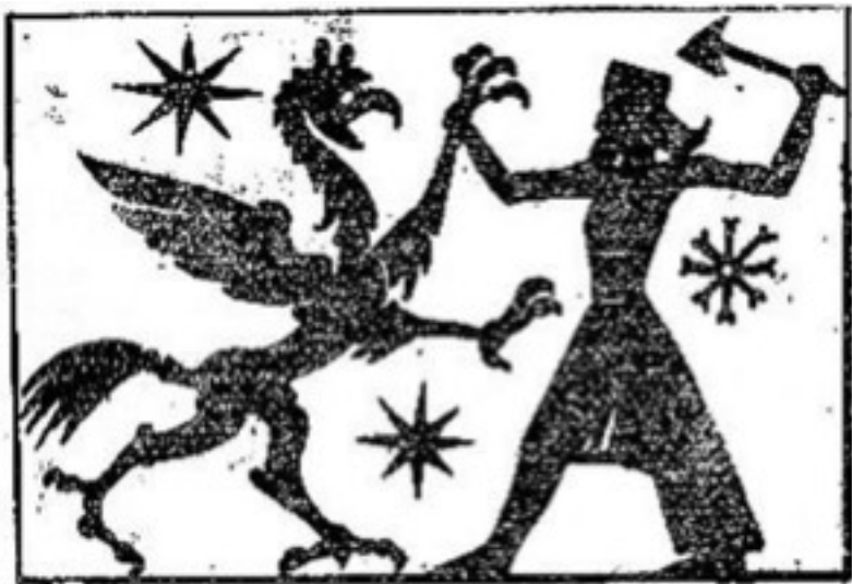
Битва Мардука с Тиамат

Его жена Тиамат (аккад. Море) в аккадской мифологии представлена олицетворением солёных вод океана, первозданной стихией и воплощением хаоса. Тиамат является праматерью всего пантеона богов.