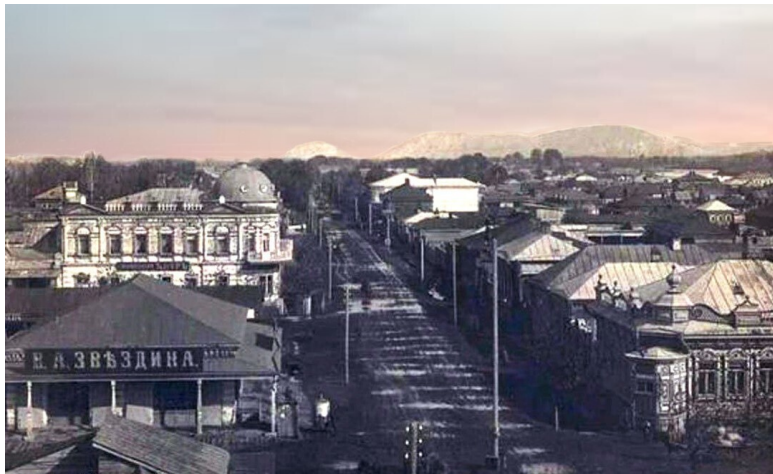
Иллюстрация: перспектива улицы Большой Заводской в Стерлитамаке, вид на север. На горизонте – шиханы Юрак Тау и Куш Тау, вид с балкона здания Земской управы. На этом отрезке 12 июля 1918 года произошло столкновение защитников города с ворвавшимися в город врагами. Дореволюционная почтовая открытка, художественно обработанная автором.