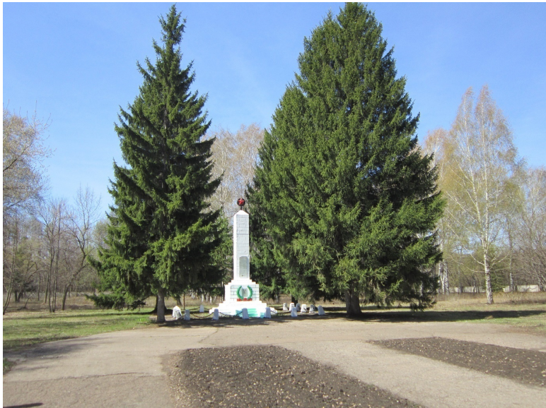
Сквер «Пятая верста» в городе Стерлитамаке.