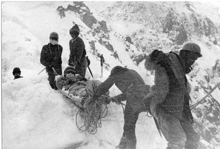
Транспортировка пострадавшего по леднику

нии на вершину Кундюм-Мижерги по маршруту 4Б категории сложности она сорвалась на ледовом рельефе и получила тяжелую травму, сложный перелом голени правой ноги. Авария произошла на высоте 4200 метров, и если бы не оперативная работа спасателей, то невеста моя имела все шансы не дожить до свадьбы, запланированной на конец августа.