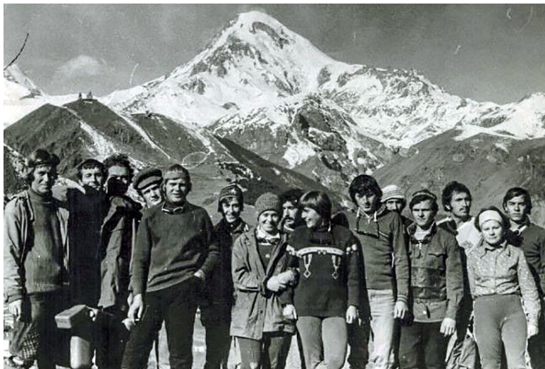
Грозненская команда перед выходом на Казбек, 1977 г.