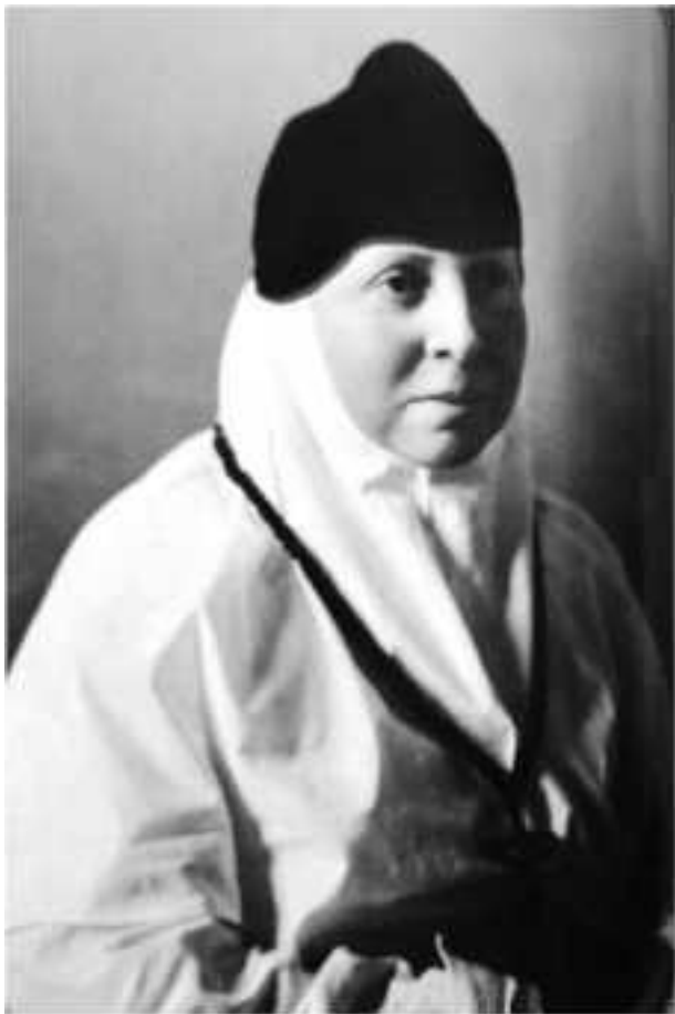
Ил. 16. Великая княгиня Александра Петровна Романова (1838–1900)