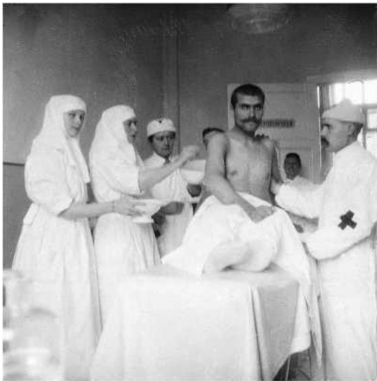
Ил. 25. За работой

По воскресеньям перевязок не было. Императрица приезжала под вечер, обыкновенно со всеми четырьмя дочерьми (младшие по будням были заняты уроками и на перевязках не бывали). Иногда привозили Наследника. Изредка приезжал Государь» [1, с. 296].