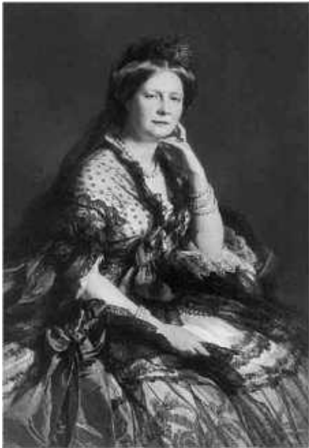
Ил. 17. Великая княгиня Елена Павловна Романова (1806–1873)

Во время Крымской войны в России был официально