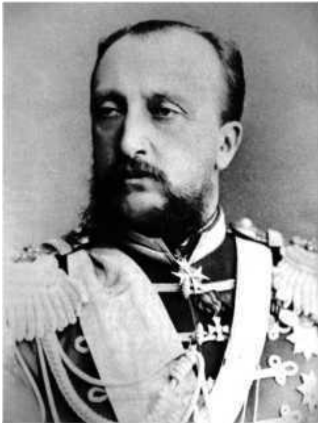
Ил. 2. Великий князь Николай Николаевич Романов Старший (1831–1891)

2. Великий князь Николай Николаевич Романов Стар-