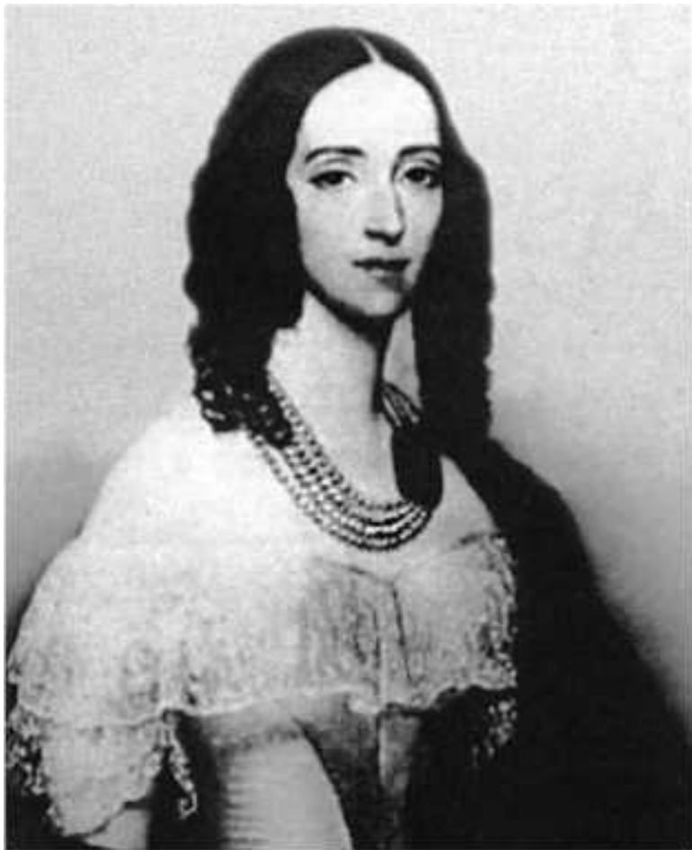
Ил. 13. Принцесса Терезия Васильевна Ольденбургская