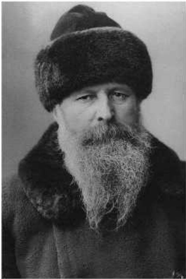
Ил. 37. Русский художник-баталист Василий Васильевич Верещагин (1842–1904)