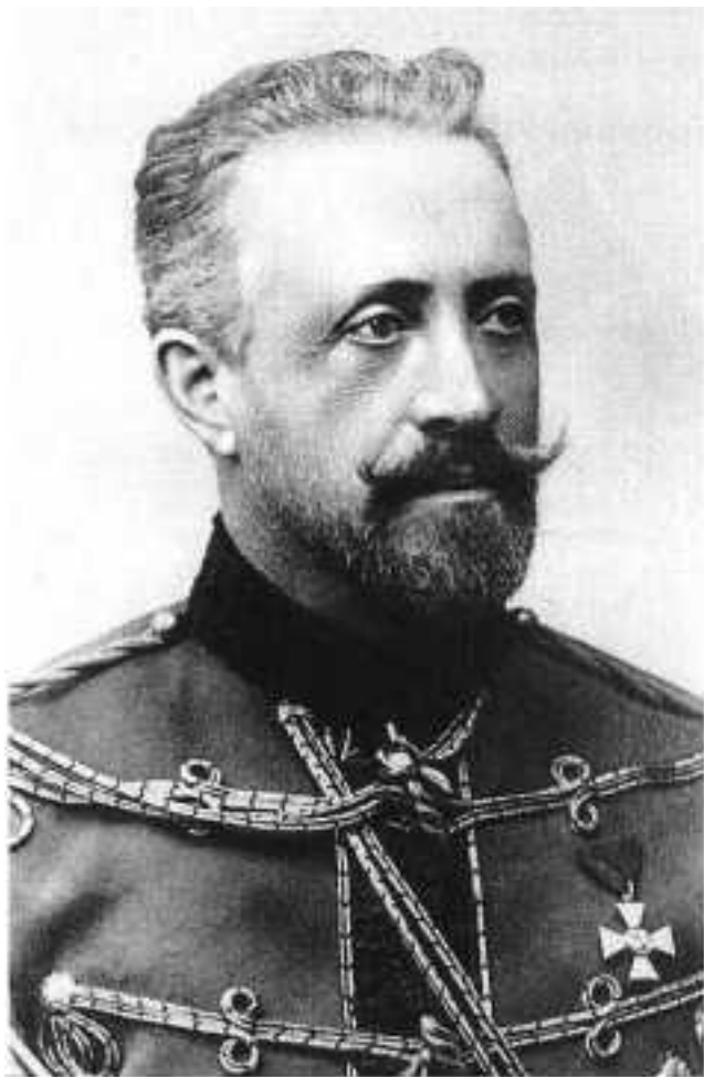
Ил. 5. Великий князь Николай Николаевич Романов Младший (1856–1929)