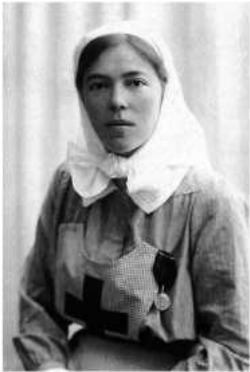
Ил. 18. Великая княгиня Ольга Александровна Романова (1882–1960)

С 1915 г. она возглавляла собственный госпиталь в Киеве. Самые заклятые враги династии не могли сказать ничего, кроме самого хорошего, о ее бескорыстной работе по уходу за ранеными. Она всегда была одета, как простая сестра ми-