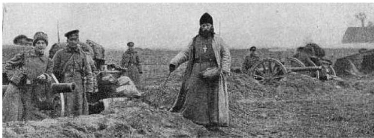
Ил. 47. Священник на передовой

Люди, прославленные как преподобные, вели такую подвижническую жизнь, что, по благодати Божией, восстановили в себе образ и подобие Божие. А приставка пре- говорит о том, что сделали они это в превосходной степени.