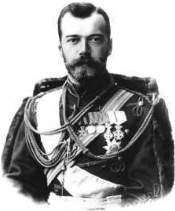
Ил. 1. Император Николай II (Романов) (1868–1918)

1. Последний император России Николай Александрович Романов, являвшийся Верховным главнокомандующим русской армией и флотом в самый победоносный для России период Первой мировой войны. Основным его вкладом в дело руководства страной во время Первой мировой войны было принятие на себя летом 1915 г. верховного командова-