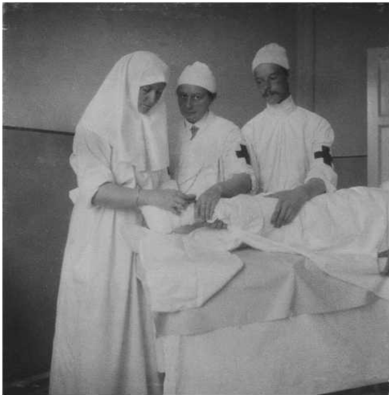
Ил. 26. За перевязкой

Воины, получавшие помощь из рук представительниц императорского дома, были благодарны им за приложенные усилия и понесенный тяжелый труд. Им посвящали стихи, писали благодарственные отзывы об их служении. Вот, на-