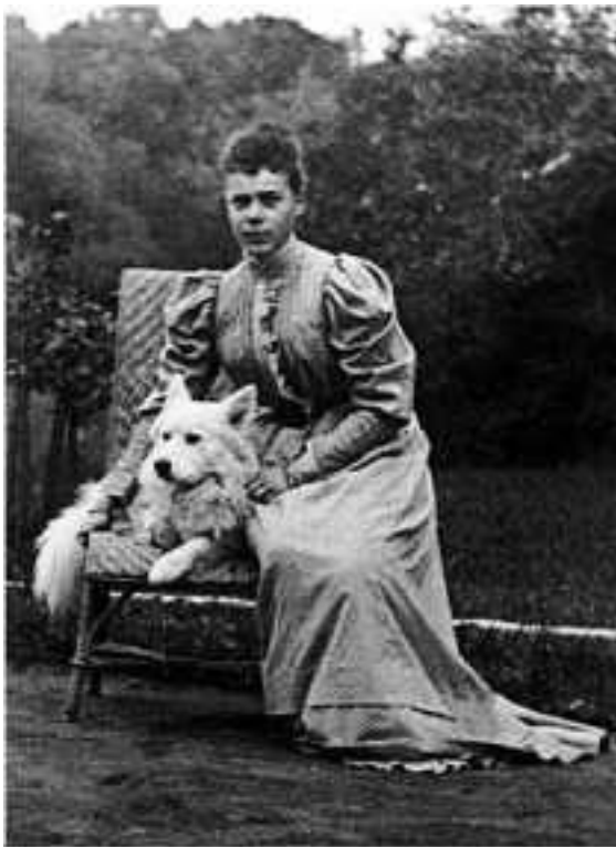
Ил. 19. Великая княгиня Ксения Александровна Романова (1875–1960)

Другая сестра Николая II, великая княгиня Ксения Александровна Романова, заведовала госпиталем для раненых и выздоравливающих в Санкт-Петербурге. Однако наибольшую известность в смысле помощи раненым во время Пер-