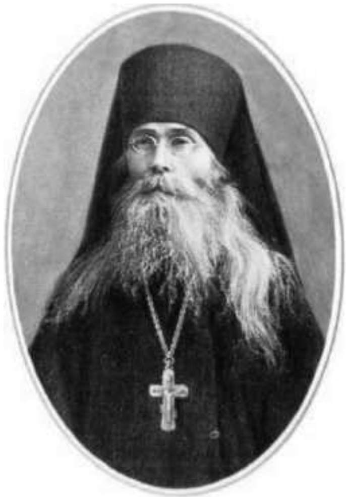
Ил. 35. Преподобный Варсонофий Оптинский (1845–1913)