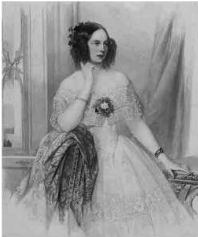
Ил. 15. Великая княгиня Мария Николаевна Романова (1819–1876)

После смерти принцессы Терезии Свято-Троицкую общину возглавила великая княгиня Мария Николаевна, старшая дочь императора Николая I.