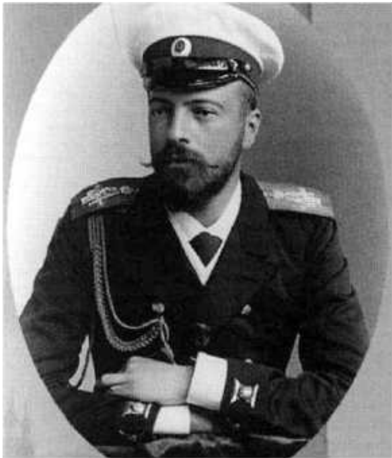
Ил. 10. Великий князь Александр Михайлович Романов (1866–1933)