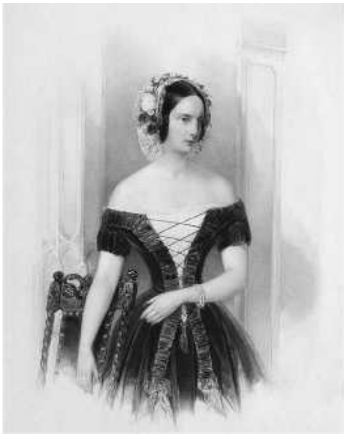
Ил. 14. Великая княгиня Александра Николаевна Романова (1825–1844)