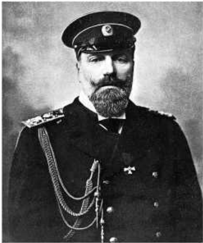
Ил. 8. Великий князь Алексей Александрович Романов (1850–1908)

2. Великий князь Алексей Александрович Романов (1850–1908), четвертый сын Александра II, последний генерал-адмирал (во главе флота стоял 24 года, после Константи-