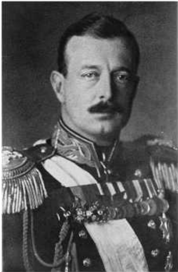
Ил. 11. Великий князь Кирилл Владимирович Романов (1876–1938)