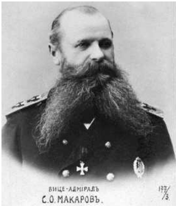
Ил. 38. Вице-адмирал Степан Осипович Макаров (1848–1904)

Выдающийся ученый-теоретик и бесстрашный воин, неутомимый защитник интересов России вице-адмирал С.