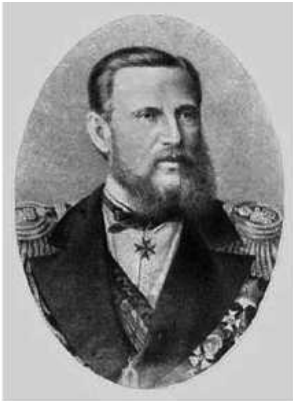
Ил. 7. Великий князь Константин Николаевич Романов (1827–1892)

1. Великий князь Константин Николаевич Романов. Реформатор российского флота. После гибели Черноморского флота под Севастополем во время Крымской войны (1853–