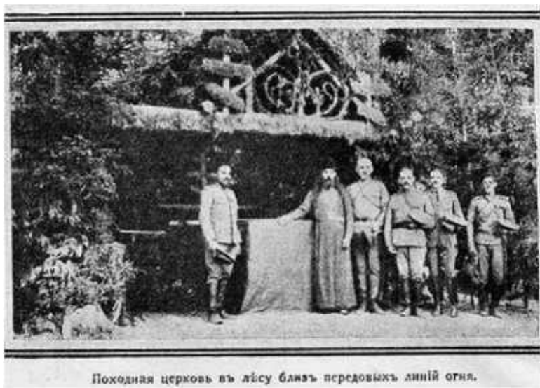
Походная церковь в лесу близ передовых линий огня.

Такой же сумбур царил и в понятиях мирных военных начальников о церковном деле на войне» [35, л. 8].