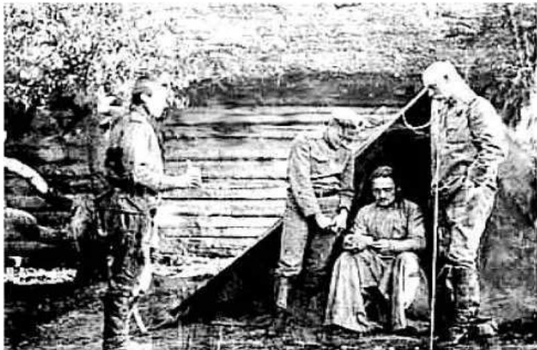
Ил. 46. Полковой священник в окопах

«За предыдущие войны появление священника в окопах во время боя считалось подвигом, в эту войну непосещение окопов вменялось в преступление. Раньше работа военного священника сводилась, главным образом, к требоисправлению, все прочее считалось уже сверхдолжной заслугой. В эту войну круг обязанностей военного священника вырос, расширился, углубился, захватив и те стороны быта и нужд военного времени, на которые раньше никто не обращал внимания.