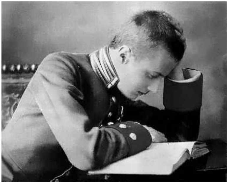
Ил. 6. Великий князь Олег Константинович Романов (1892–1914)

5. Геройски погиб на поле брани в самом начале Первой мировой войны великий князь Олег Константинович Романов, младший сын великого князя Константина Константиновича Романова. На войну юный великий князь отправился сразу же после выхода приказа о всеобщей мобилизации. Служил корнетом в Гусарском Е. И. В. полку, который вошел в состав 1-й действующей армии. Боевое крещение по-