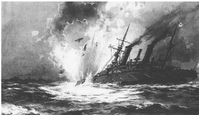
Ил. 36. Гибель броненосца «Петропавловск»

Еще два священника – участника Русско-японской войны были причислены к лику святых: священномученик Сергей Флоринский, расстрелянный большевиками в 1918 г., а также преподобный Варсонофий Оптинский, служивший в отряде Красного Креста [54, с. 142].