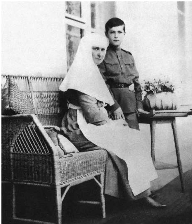
Ил. 22. Императрица Александра Федоровна с цесаревичем Алексеем

Лечебные учреждения для раненых воинов часто имено-