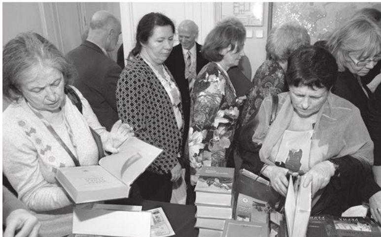
Знакомство с изданиями Международного Центра Рерихов