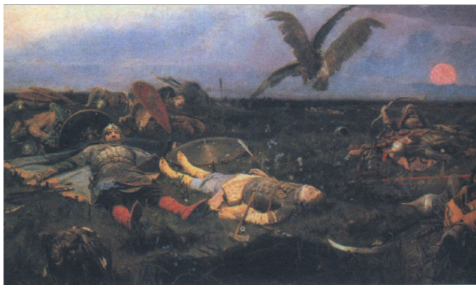
«После побоища Игоря Святославича с половцами» Васнецов В.М.