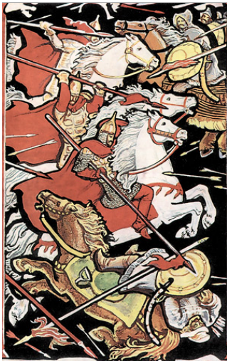
«Битва князя Игоря с половцами» Архипов И.