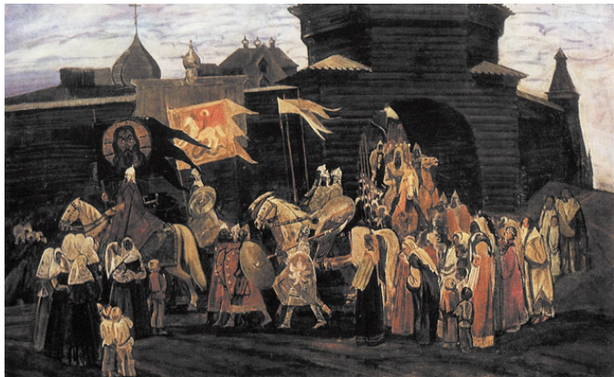
«На половецкие степи» Жабский А.