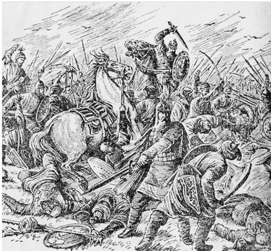
«Битва русских с половцами» Пергаменщик Е.