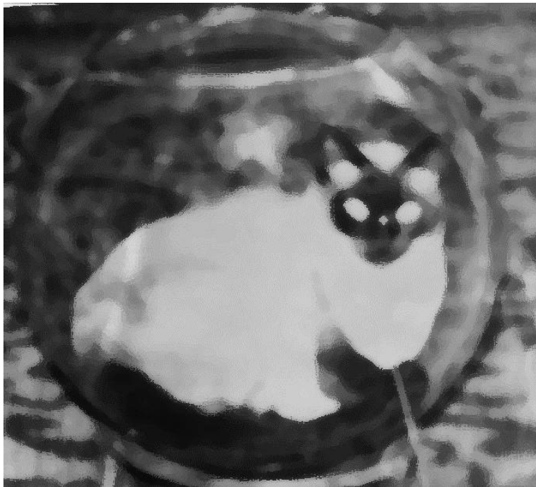
Сима в аквариуме

Сима полюбила сидеть в аквариуме, доставшемся ей в наследство от Хом. Иногда ей нравилось играть, лежа в нём на спине и доставая нас оттуда лапой.