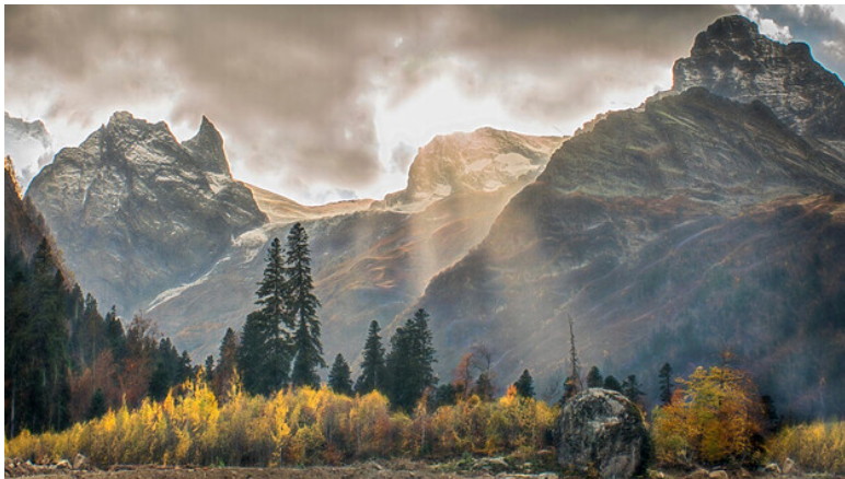
Зачарованный ноябрь

Вечнозеленые цвета, Могучих ельников на скалах. Вершин немая красота,