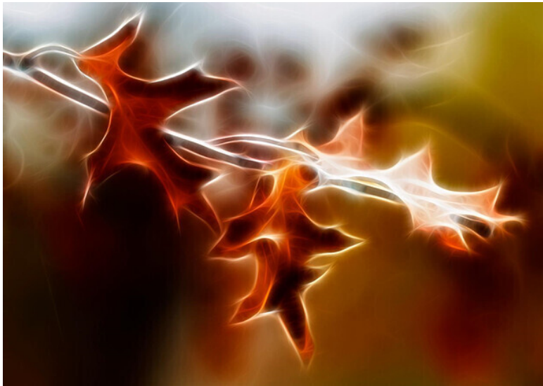
Бронзовая осень

Подернулась оттенком бронзы осень, Пожаром листьев загорелся клен. И ветер в парке грусть печали носит, И раздается колокольный звон.