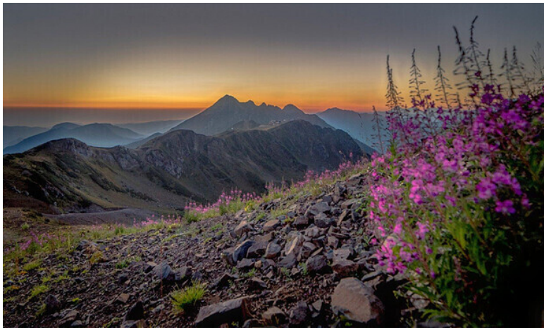
Вид на закат