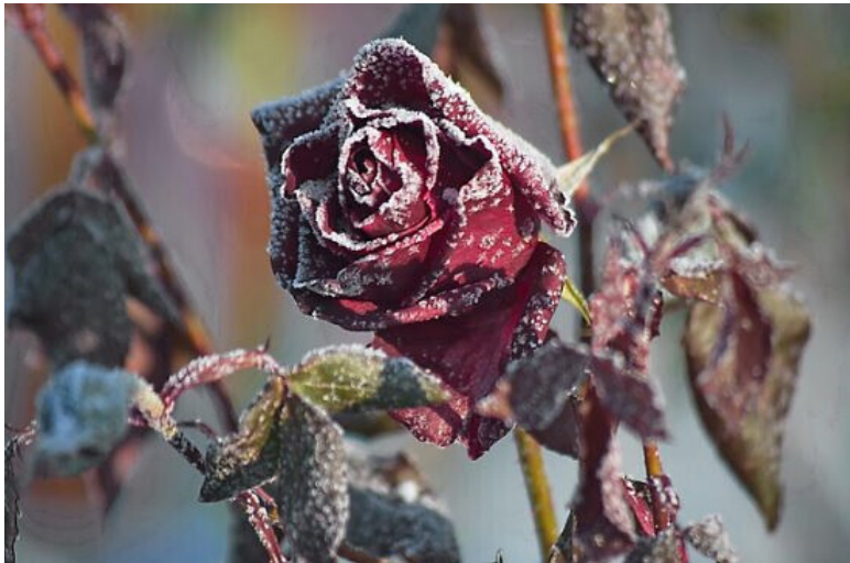
Январская роза