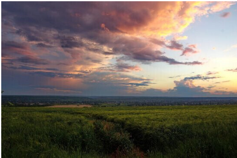
Однажды вечером в июне