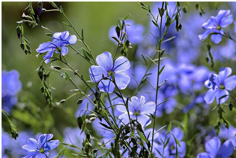
В цвете льна

В цвете льна «сарафан» из бескрайнего поля, Ветер гонит волну по «цветочным морям». Как прекрасно, что выпала мне эта доля,