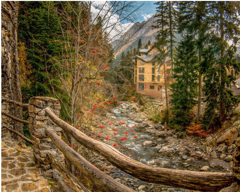
А, завтра первый снег

А, завтра будет первый снег, Он ляжет легкою перинкой. И новый светлый день «с горчинкой», Мелькнет, прославив этот век.