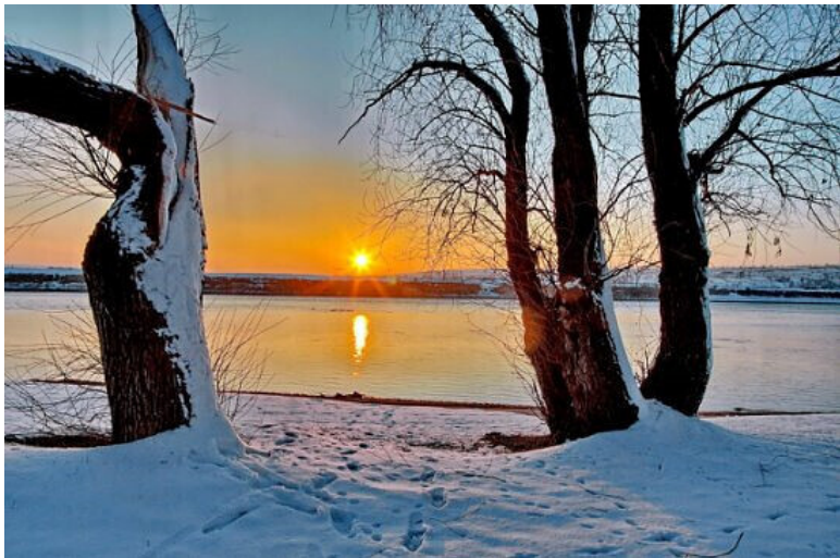
Последний след

Все в жизни оставляет след, Он никуда не исчезает. С заходом солнца яркий свет, До утра только затухает.