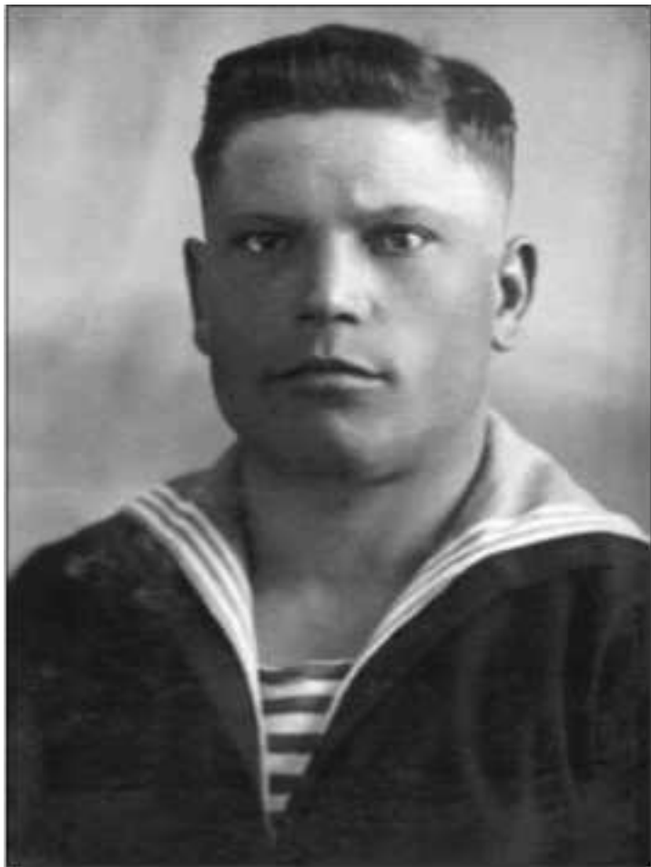
Автомеханик 12-й КОИАЭ