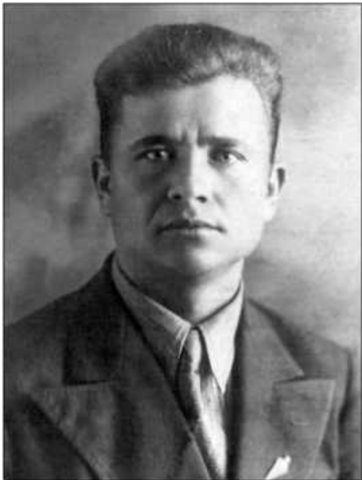
Лётчик 12-й КОИАЭ