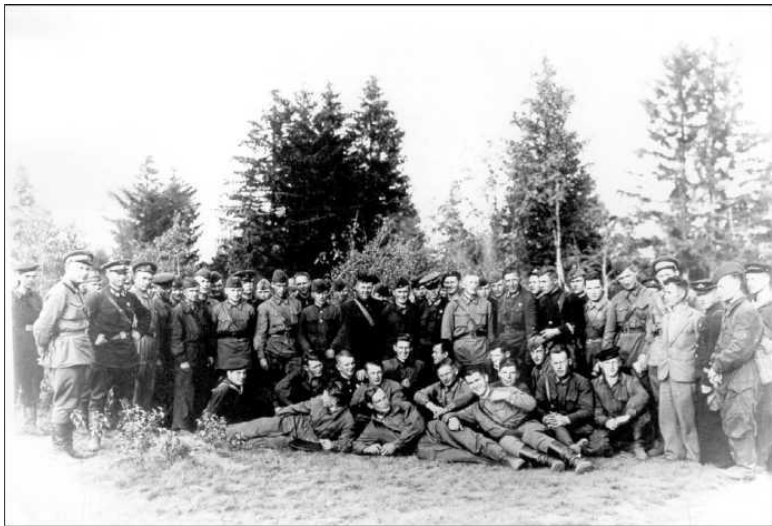
Аэродром Выстав. Личный состав 12-й КОИАЭ. 1942 г.

Рейфуги для укрытия самолётов были маленькие, только для истребителей И-16, а МиГ-3 вмещался только до кабины. С мая начались обложные дожди, грунтовая взлётно-посадочная площадка размокла и стала непригодной для полётов. Боевые действия авиации на аэродроме Гражданка прекратились.