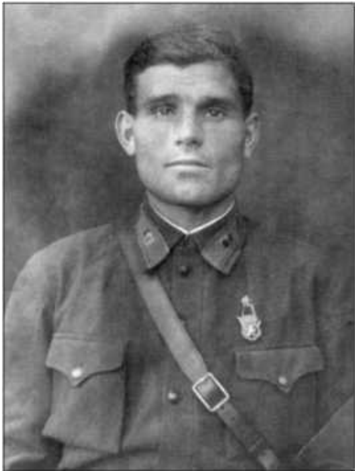
Командир пулемётного батальона 79-го стрелкового полка