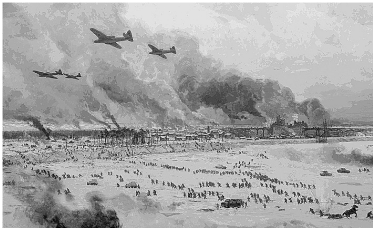
Прорыв блокады Ленинграда