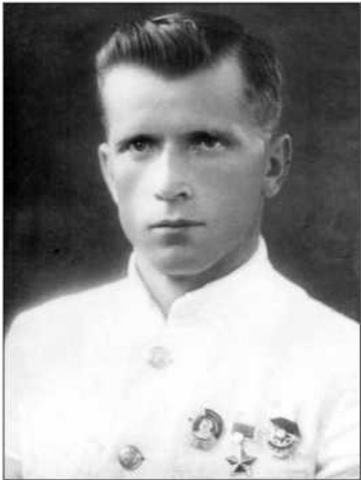
Герой Советского Союза комиссар 13-й КОИАЭ, капитан Иван Иванович Волосевич. 1940 г