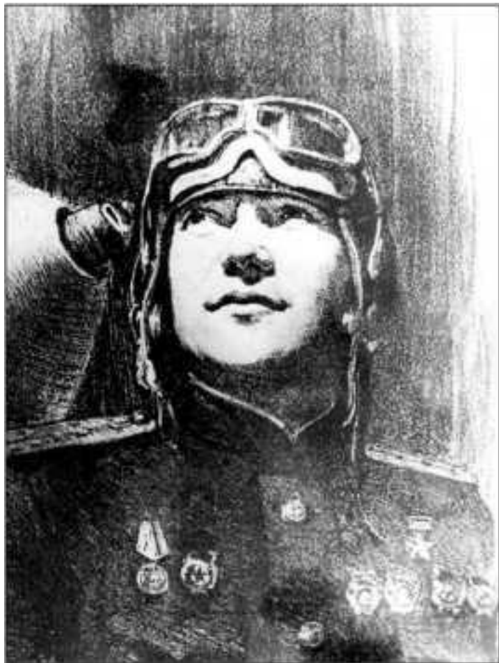
Командир 12-й КОИАЭ Герой Советского Союза гвардии