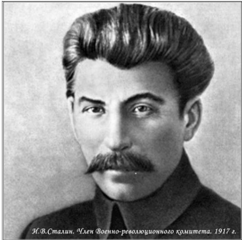
И. В. Сталин. Член Военно-революционного комитета. 1917 г.