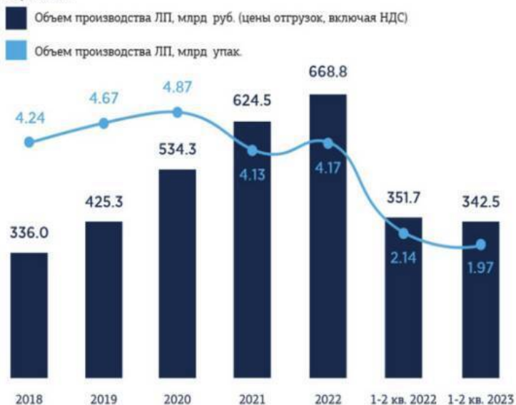
Рис.3. Объем производства ЛП в России за 2018- 1-2 кв. 2023 гг. в натуральном и денежном выражении

Но вопрос к Росстату здесь другой. Вот данные «Делового профиля»: