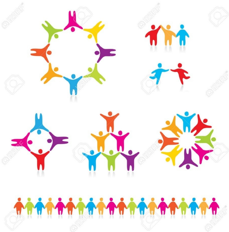
Рис. 3. Распределение детей на рабочие подгруппы во время интегративного обучения.

Очень хорошо в данную модель интегрируется, например, методика «мозаичный класс» и многие другие. При занятиях некоторые элементы проходят в кругу группы, а некоторые ребята выполняют самостоятельно в группах по три или