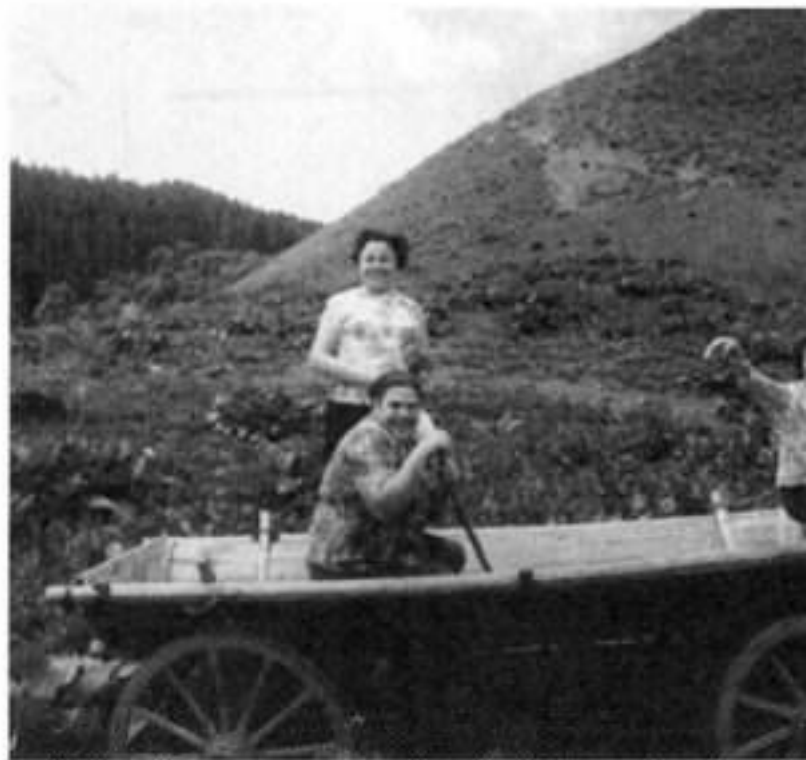
«Телега истории». Будущие первые леди (стоит) и Р.М.Горбачева (сидит справа). Архивное фото.