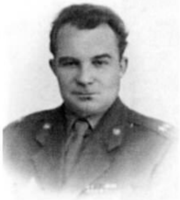
Начальник Управления КГБ по Минской области.