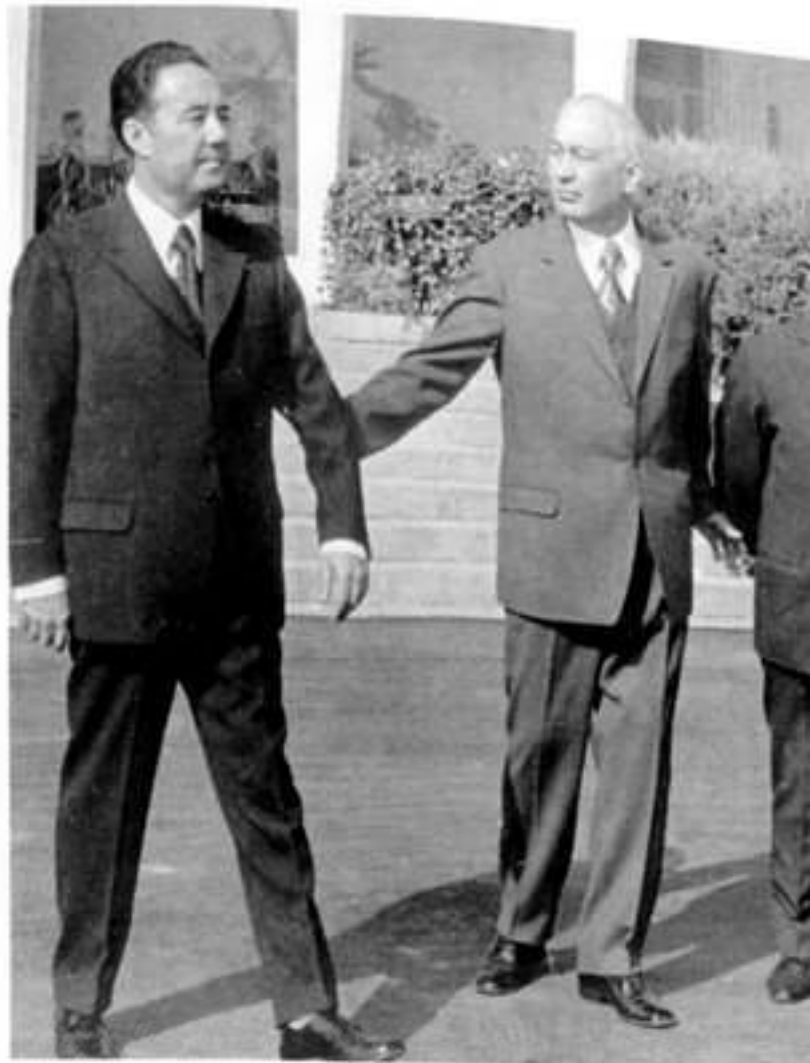
Дважды лауреат Сталинской премии