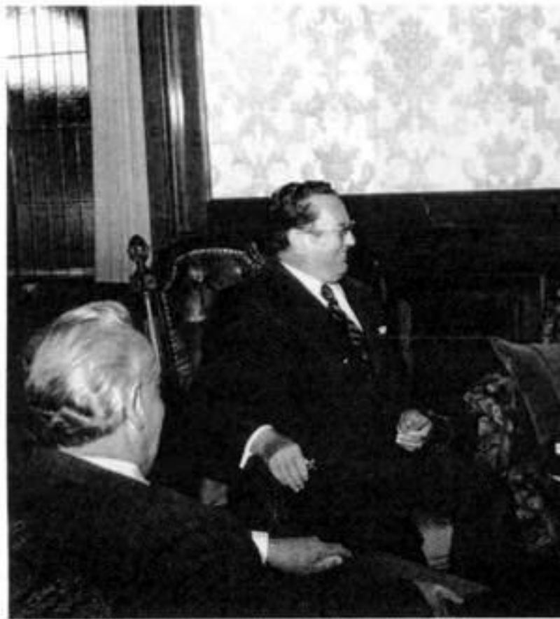
Глава советской правительственной делегации Встречи с председателем Президиума