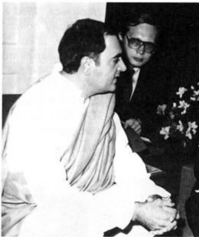
Премьер-министр Индии Раджив Ганди