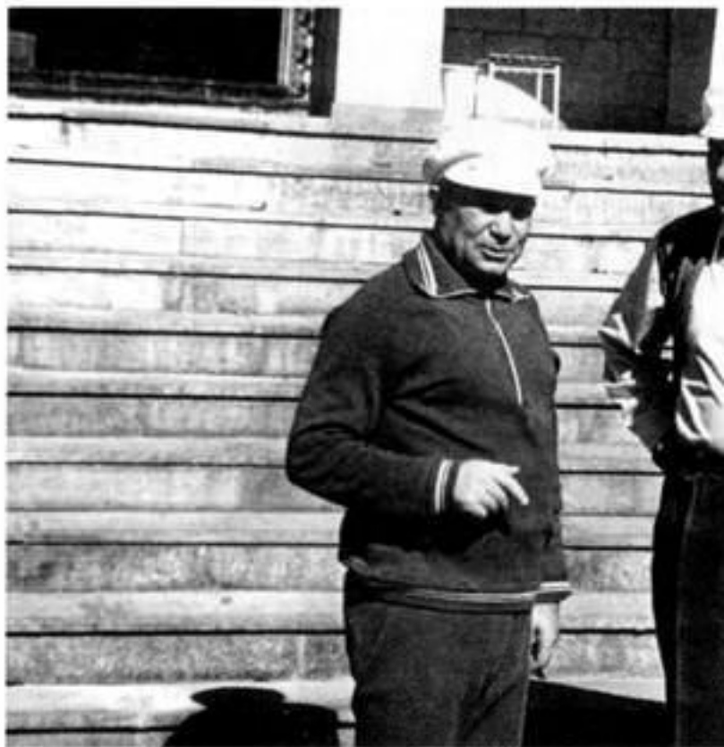
С Яношем Кадаром, руководителем Венгрии. Во время его отдыха в Кисловодске. 1970-е годы.