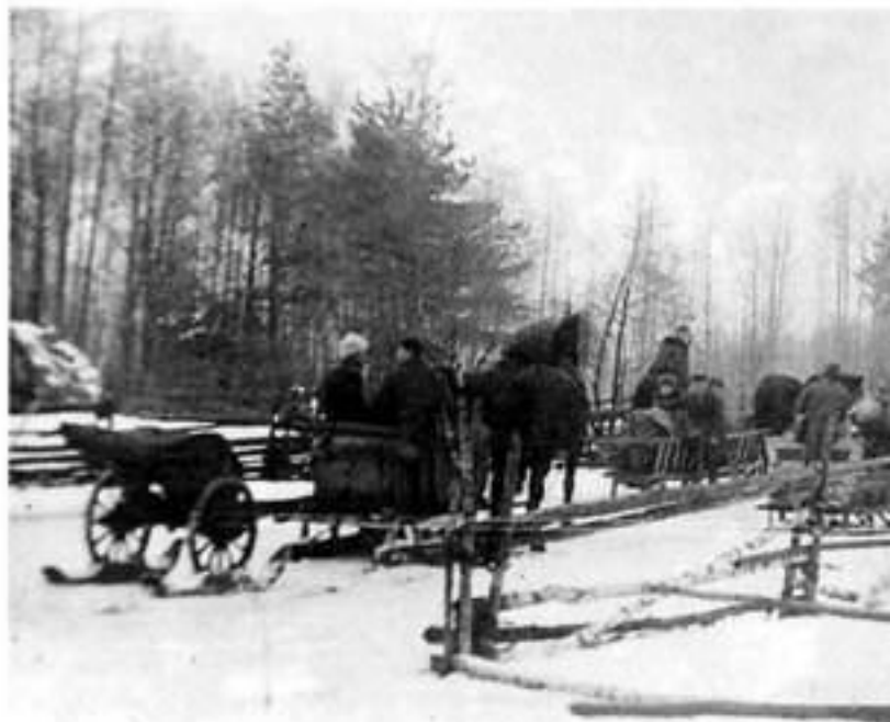
Партизанский отряд на марше. Зима 1942 года. Пинская область.