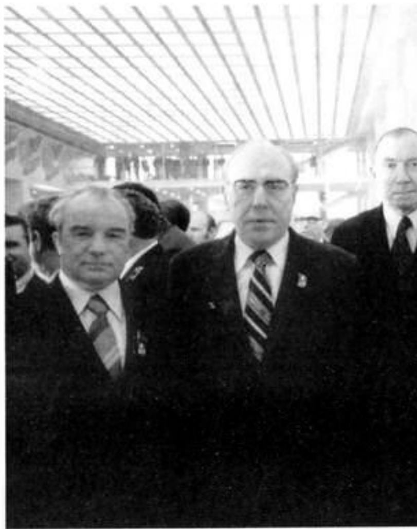
Бюджетный КФБ в Бюджетном Кремлевском