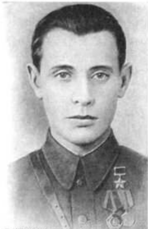
П. М. Машеров — секретарь Вилейского подпольного обкома комсомола, Герой Советского Союза.