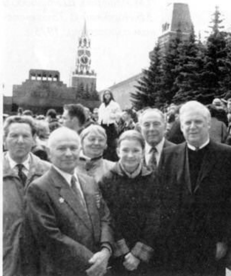
Н.И.Рыжков среди ветеранов на Красн