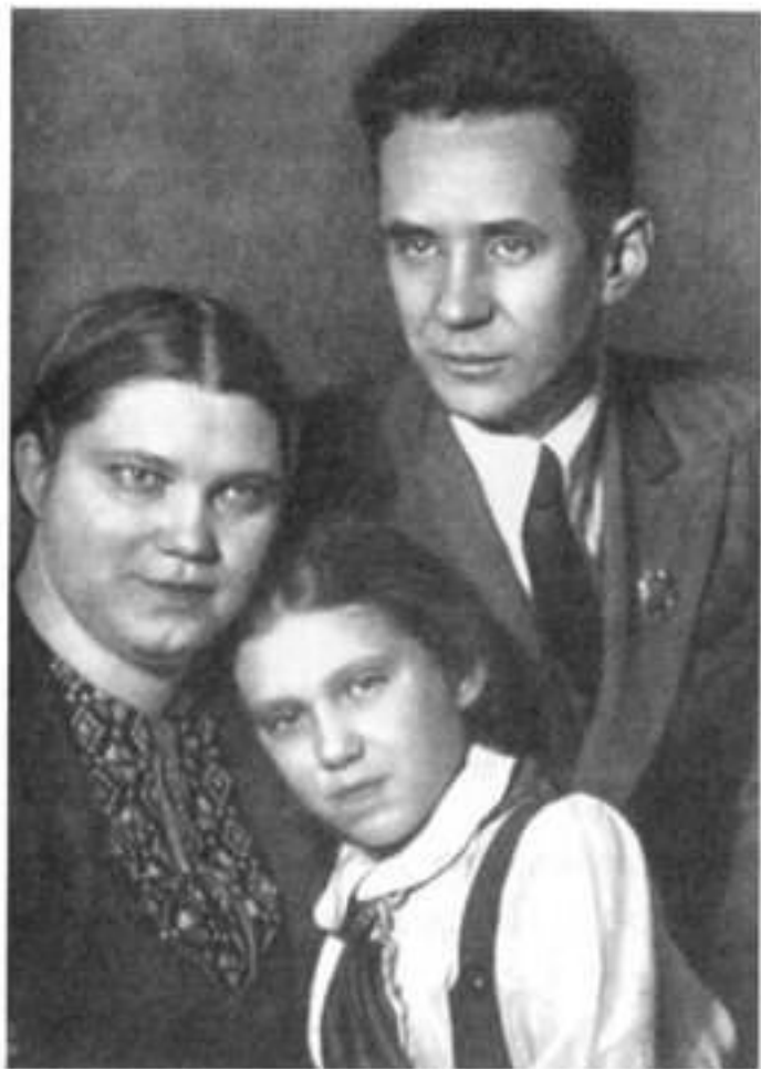
А.Н. с же и до