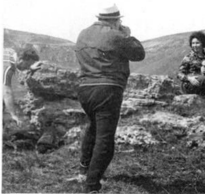
Неожиданный ракурс... Ю.В.Андропов ф. Горбачевых и Э.Б.Нордмана.