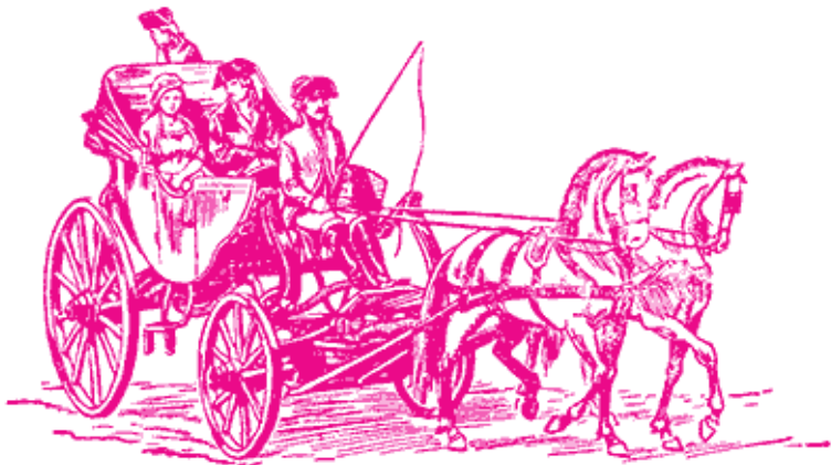
Дворянский выезд конца XVIII века