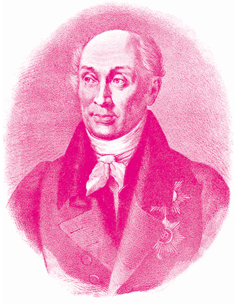
Граф М. М. Сперанский.