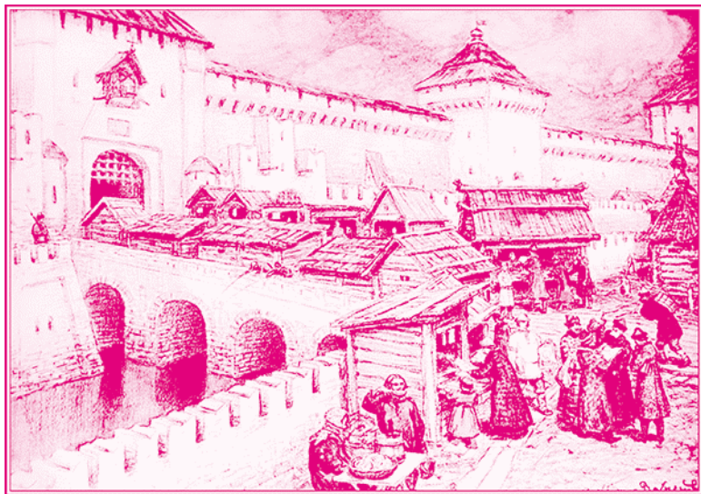
А. Васнецов. Книжные лавочки на Спасском мосту в XVII веке. 1916 г.

государства и общества. Но для этого нужны были знания, каких не имела и которыми пренебрегала Древняя Русь, особенно изучение природы и того, чем она может служить потребностям человека: отсюда усиленный интерес русского общества XVII в. к космографическим и другим подобным сочинениям. Само правительство поддерживало этот интерес, начиная подумывать о разработке нетронутых богатств страны, разыскивая всякие минералы, для чего требовалось то же знание.