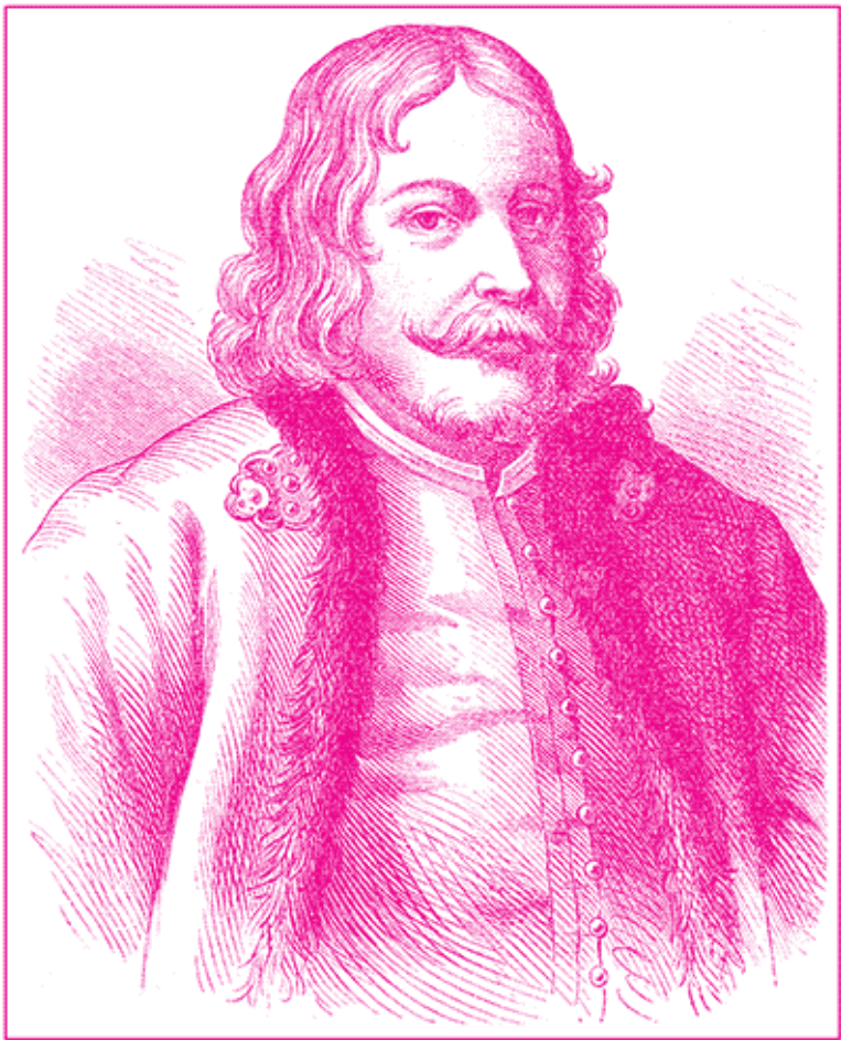
Василий Васильевич Голицын.