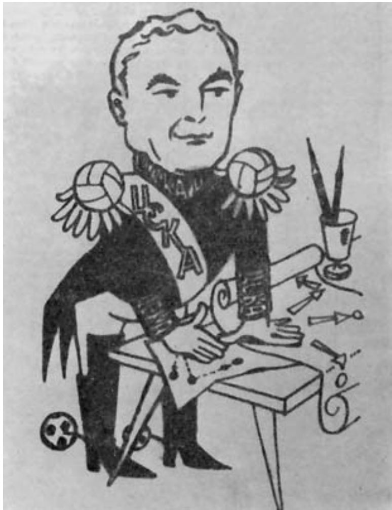
Дружеский шарж. В честь победы в чемпионате